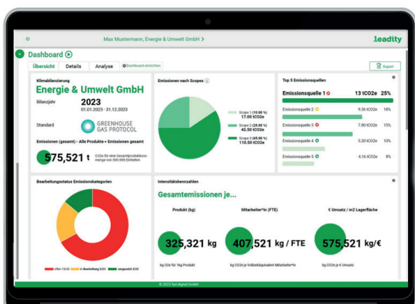
Dashboard von leadity, der digitalen Plattform für Nachhaltigkeitsstrategie, Management und Berichterstattung.

Mit „leadity“ lassen sich Nachhaltigkeitsdokumentationen in einer Software erstellen! Zudem hat leadity eine vierstufige Hierarchiestruktur, so dass zum Beispiel auch Hotelketten mit untergeordneten Betreibergesellschaften ihre komplette Nachhaltigkeitsdokumentation in leadity zentral steuern und auswerten können!